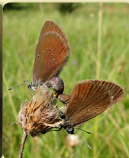
Albăstrelul ciocolatiu al furnicilor Maculinea nausithous