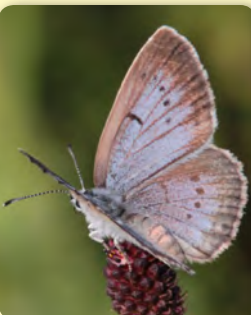
Albăstrelul argintiu al furnicilor Maculinea teleius

2. Dealurile Clujului Est este singurul loc în care sunt prezente toate speciile europene de fluturi, aparținând genului periclitat Maculinea , cunoscuți de localnici ca "albăstreii furnicilor".