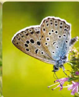
Albăstrelul mare al cimbrisorului Maculinea arion