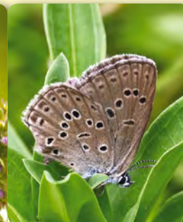
Albăstrelul comun de gențiană Maculinea alcon

Utilizare tradițională a terenurilor în Borșa-Cătun (Dealurile Clujului Est)